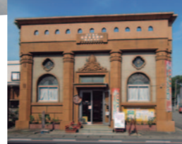
※喜連川の情報館「和い話し広場」は、大正2年に「旧喜連川興業銀行」の本店として建設され、100年前の姿を今に残す歴史的建物。

マヌーシュ・ジャズ、ボサノバ、ブルーグラス、クラシック、などさまざまなスタイルの音楽が楽しめる石蔵ライブ。大正2年に建てられた『旧喜連川興業銀行本店』の石蔵倉庫がホットなライブハウスに！ 観光ボランティアによる『日本一小さな大名喜連川城下町の観光案内』も開催。