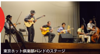
東京ホット倶楽部バンドのステージ

喜連川公民館ホールでのメインステージは、市民参加の豪華なライブ。「宇都宮新ジャズオーケストラ」と「ABCオーケストラ」のビッグバンドでイングリッシュ・ジャズ、おまじかっ！『東京ホット倶楽部バンド』のマヌーシュ・スイングに酔いましょう！ スゴ腕のゲストを迎えてのホットな演奏をお楽しみに！