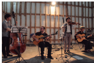
『喜連川の情報館 “和い話の広場”』は、大正2年に「旧喜連川興業銀行」の本店として建設され、100年前の姿を今に残す歴史的建物。

ジブシーミュージックをジャズと融合させ、その後の音楽の世界に計り知れない影響を与えた伝説のギタリスト“ジャンゴ・ラインハルト”。その名前を冠した『さくら ジャンゴ・ラインハルト・フェスティバル』は、往時を偲ばせる“マヌーシュ・ジャズ”はもとより、ビッグバンド・ジャズからブルーグラス、クラシックその他さまざまな音楽をフィーチャーした楽しいイベントです。